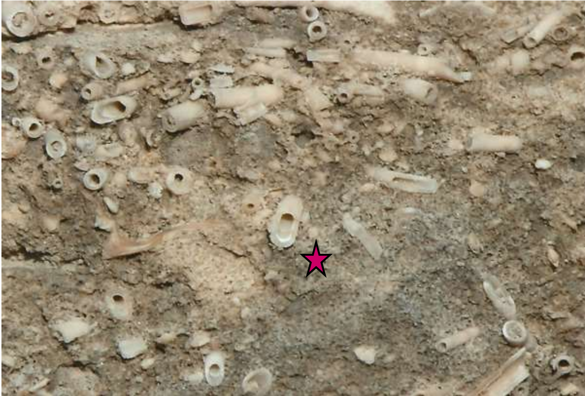
3 Photos Roches et Carrières

Grossissement du banc de Saint-Leu avec des ditrupes (étoile rouge)