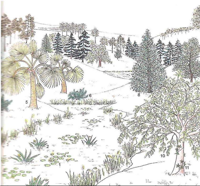
Dessin de Grambast [219] flore des argiles à meulières

Le Stampien prend fin il y a 28,1 Ma par une situation assez paradoxale : bien qu'il n'y ait pas du tout de calottes polaires le niveau des mers est au plus bas.