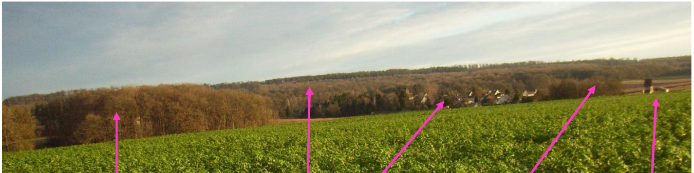
Le petit bois