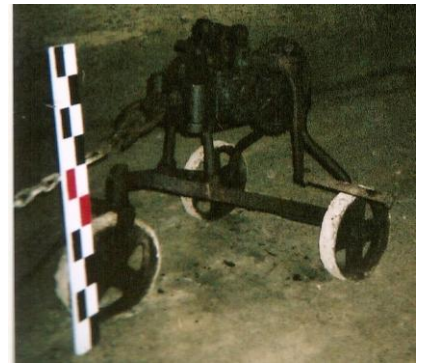
Vindas dans la carrière du Chemin de Vez

Ces engins de traction de type cabestan ont une chaîne entraînée par la "noix du vindas", une pièce d'acier formant le négatif d'un maillon de chaîne. Le vindas comporte deux ou trois démultiplications. Les treuils et les vindas exigeaient d'être très solidement amarrés.